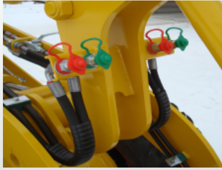
3. + 4. Steuerkreis