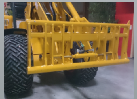
Geräteschnellwechsler hydraulisch Euro-Norm